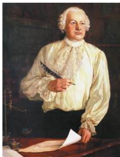
М. В. Ломоносов - созда- тель Московского у-та (1755 год).

Наверняка, у каждого из вас есть хотя бы один значок. Покажите его друзьям и расскажите о том, что он обозначает, и как вы его добыли.